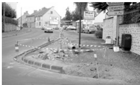
Pose de bordures à l'angle de la Place de Verdun.

Les marchés ont été obtenus par l'entreprise André Espaces Verts de Lalpisse.