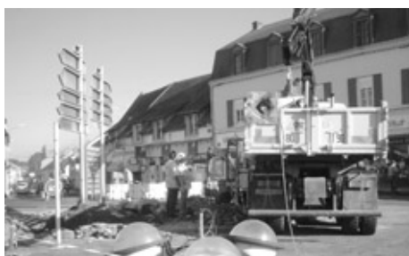
Le socle de l'ancien kiosque à musique a été déposé.

Afflux important de baigneurs à la piscine municipale au mois de juillet. Fréquentation plus mitigée au mois d'août en raison d'une météorologie plus capricieuse.