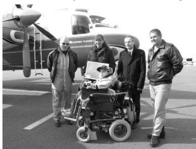
Parrainage de l'association par les pilotes des trackers de Marignane

- le 31 mars pour remettre officiellement la carte électorale ainsi que le livret du citoyen aux jeunes électeurs en âge de voter, lors de la 1 ère « cérémonie de citoyenneté ».