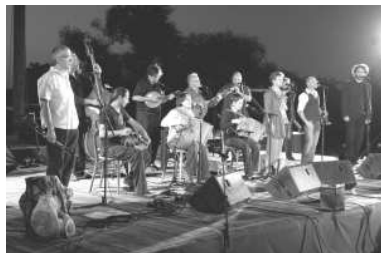
Vent de Galarne (La Chavannée)