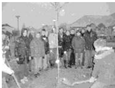
Pour clôturer leur mandat 2008/2010, les jeunes conseillers ont planté un arbre

Afin de réaliser ses projets, le CMEJ dispose d'un budget de fonctionnement. Les élus enfants et jeunes se réunissent une fois par mois au sein de 3 groupes de travail. Les animateurs qui les encadrent sont des élus du conseil municipal, mais aussi, et cela est une nouveauté, des membres du Comité des Sages que nous tenons à remercier chaleureusement. Autre changement : les élus enfants et jeunes travaillent tous ensemble sur un projet commun. Le premier a été voté à bulletin secret le 11 février 2011 en séance plénière : il s'agit d'organiser un concours de jeux de société ouvert à tous, soit à la médiathèque, soit à la Salle Laurent Grillet. Manifestation intergénérationnelle, elle permettra, selon les termes des enfants, de « faire sortir les gens », de « faire connaissance », de « faire découvrir de nouveaux jeux », aux aînés comme aux tous petits, et de « passer un bon moment ensemble ». Vous pouvez d'ores et déjà commencer à recenser les jeux que vous possédez !